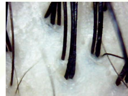
特殊スチーム洗髪後